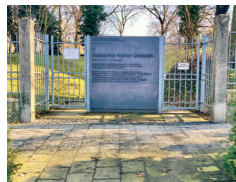
Eingang zur Gedenkstätte Friedhof Hochstraße

Samstag Treffpunkt Friedhof Hochstraße 11.4.26 Führung Elke Almut Dieter, 15 Uhr Friedenszentrum Braunschweig e.V.