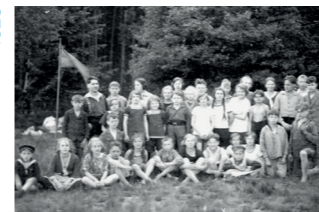
Freizeit in Essemrode 1928

Anlässlich des 100-jährigen Jubiläums der Jugendorganisation der Naturfreunde wollen wir gemeinsam Orte, Geschichten und Spuren der Arbeiterjugendbewegung in Braunschweig entdecken – mit besonderem Blick auf die Entwicklung und Bedeutung der Naturfreundejugend . Wir werfen einen Blick auf frühe Treffpunkte, politische und kulturelle Aktivitäten, Freizeit- und Bildungsangebote und darauf, wie junge Menschen in verschiedenen Epochen für Solidarität, Mitbestimmung und soziale Gerechtigkeit eingetreten sind. Eine Fahrradtour, die Vergangenheit lebendig macht und zeigt, warum diese Traditionen bis heute wirken. Wir bitten um Anmeldung bis zum 8.7.2026 unter: www.nfj-bs.de