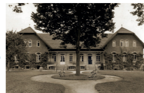
Gebäude Nr. 10, Landes-Heil- und Pflegeanstalt Königslutter 1936