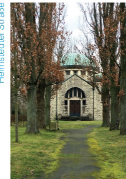
Jüdischer Friedhof Helmstedter Straße

Als der jüdische Friedhof an der Hamburger Straße fast vollständig belegt war, kaufte die Jüdische Gemeinde 1895 von der Klosterkammer Riddagshausen Gelände für einen neuen Friedhof an der Helmstedter Straße. Auf ihm wird seit 1915 beerdigt. Der Spaziergang ist Teil der Jüdischen Kulturtage zwischen Harz und Heide 2026. Eine Anmeldung ist bis zum 20.8.2026 erforderlich: info@andere-geschichte.de oder Tel. 05311 89 57 Höchstteilnehmer*innenzahl 25. Herren werden gebeten eine Kopfbedeckung zu tragen.