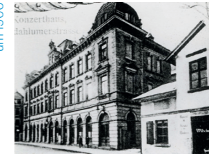
Konzerthaus Böhlerstraße um 1906

Samstag Treffpunkt Eingang Biomarkt im Büssinghof, 8.8.26 Heinrich-Büssing-Ring 41 15 Uhr Führung Reinhard Zabel, Arbeitskreis Andere Geschichte e.V.