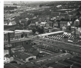
Blick über die Wilke Werke, (heute Baumarkt Hornbach)