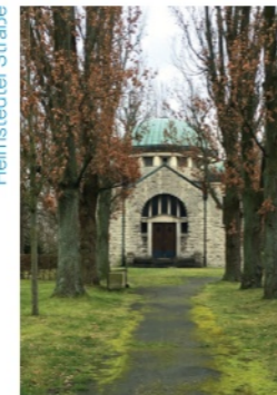
Jüdischer Friedhof Helmstedter Straße

Eine Anmeldung ist bis zum 20.8.2026 erforderlich: info@andere-geschichte.de oder Tel. 0531 1 89 57 Höchstteilnehmer*innenzahl 25. Herren werden gebeten eine Kopfbedeckung zu tragen.