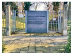
Eingang zur Gedenkstätte Friedhof Hochstraße

Samstag Treffpunkt Friedhof Hochstraße 11.4.26 Führung Elke Almut Dieter, 15 Uhr Friedenszentrum Braunschweig e.V.