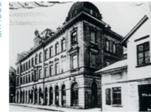
Konzerthaus Bocklerstraße um 1906

Samstag Treffpunkt Eingang Biomarkt im Büssinghof, 8.8.26 Heinrich-Büssing-Ring 41 15 Uhr Führung Reinhard Zabel, Arbeitskreis Andere Geschichte e.V.