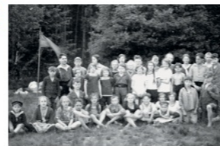
Freizeit in Essenrode 1928

Radtour Anlässlich des 100-jährigen Jubiläums der Jugendorganisation der Naturfreunde wollen wir gemeinsam Orte, Geschichten und Spuren der Arbeiterjugendbewegung in Braunschweig entdecken – mit besonderem Blick auf die Entwicklung und Bedeutung der Naturfreundejugend . Wir werfen einen Blick auf frühe Treffpunkte, politische und kulturelle Aktivitäten, Freizeit- und Bildungsangebote und darauf, wie junge Menschen in verschiedenen Epochen für Solidarität, Mitbestimmung und soziale Gerechtigkeit eingetreten sind. Eine Fahrradtour, die Vergangenheit lebendig macht und zeigt, warum diese Traditionen bis heute wirken. Wir bitten um Anmeldung bis zum 8.7.2026 unter: www.nfj-bs.de