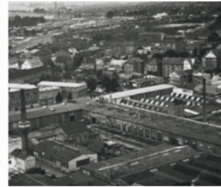
Blick über die Wilke Werke, (heute Baumarkt Hornbach)

Zwischen Madamenweg und Frankfurter Straße erstrecken sich Wege und Gebäude, hinter denen sich lange Geschichten verbergen. Wo im vorletzten Jahrhundert noch Gärten dominierten, entwickelte sich im 19. Jahrhundert eine rege Industrie. Was während des Nationalsozialismus im sozialdemokratisch