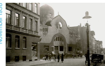
Die ausgebrannte Synagoge in Peine, November 1938